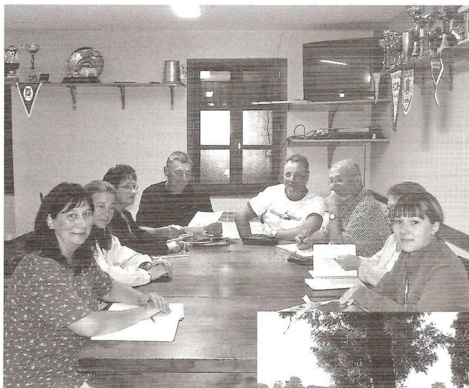
◀ Membres du Bureau de l'Amicale des Supporters

Tous ensemble nous pourrons contribuer au succès de ce club qui est notre fierté.